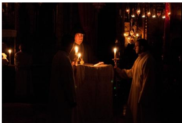
Lecture de l'Evangile à la lumière des bougies