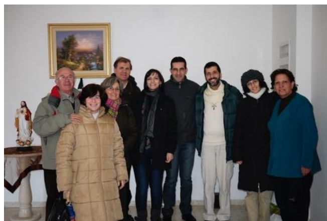
Chez une famille de Beit Jala

Après le repas, visite d'une famille ; nous prions en particulier pour un jeune couple à peine marié. Que le Seigneur leur donne la force de continuer à vivre ici et à être témoins de son amour, alors que tant de chrétiens émigrent, à cause de la situation économique catastrophique ! Je m'en rends compte quand un homme frappe à la fenêtre de la voiture pour vendre quatre barres de chocolat pour le prix dérisoire d'un shekel : 25 centimes ! Il est surpris que je lui en donne cinq. Nous retournons ensuite à Beit Jala pour visiter brièvement Beit Ibrahim , la Maison d'Abraham, une superbe auberge destinée au dialogue interreligieux.