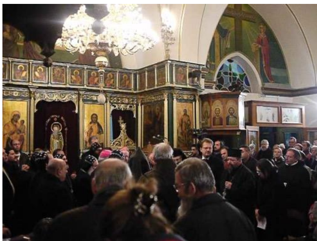
L'échange de la paix dans l'église copte

( http://www.ktotv.com/videos-chretiennes/emissions/nouveautes/direct-priere-pour-la-reconciliation-a-jerusalem-eglise-copte-orthodoxe/00064390 ). Ce mouvement invite les églises à prier pour l'unité en communion avec les chrétiens de Jérusalem « dans l'espérance que les intentions de cette prière se réalisent ensuite dans le monde entier, conformément à la vocation unique de la ville sainte, comme point de départ, historique et symbolique, des plus belles promesses et prophéties des Ecritures, et comme lieu de grâce particulière pour la famille humaine ». (Is. 2,1-5 ; voir le site : http://www.prayrup.info/fr/accueil )