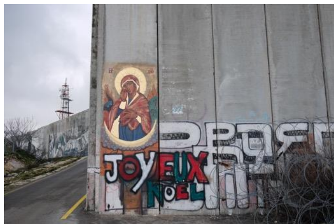
« Notre Dame qui fait une brèche dans le mur ». Icône sur le mur entourant Bethléem

impressions et réflexions sur cette semaine de prière pour l'unité.