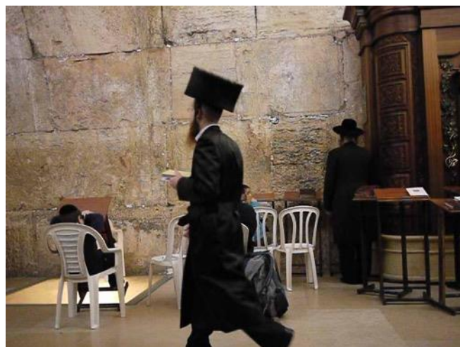
Devant le Kotel

comprirent qu'ils parlaient de son corps. Nous sommes son « Corps » et le temple de son Esprit. M'attendait-il dans « les plus petits de ses frères » que je viens de rencontrer ?