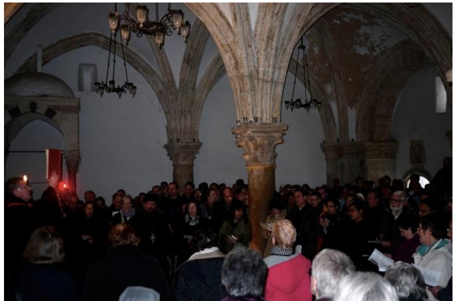
Dans le cénacle ou la chambre haute

Ce sont les premières paroles qu'il dit à ses disciples après sa résurrection. Pas un mot de reproche envers ceux qui l'avaient abandonné, il n'a que la paix à leur donner. Comme sur la croix, Jésus pardonne. Sans le pardon, on ne peut jamais arriver à la paix. Jésus donne le pardon et la paix de manière souveraine ; il passe à travers la porte fermée. Voici ce que nous pouvons découvrir en cet endroit.