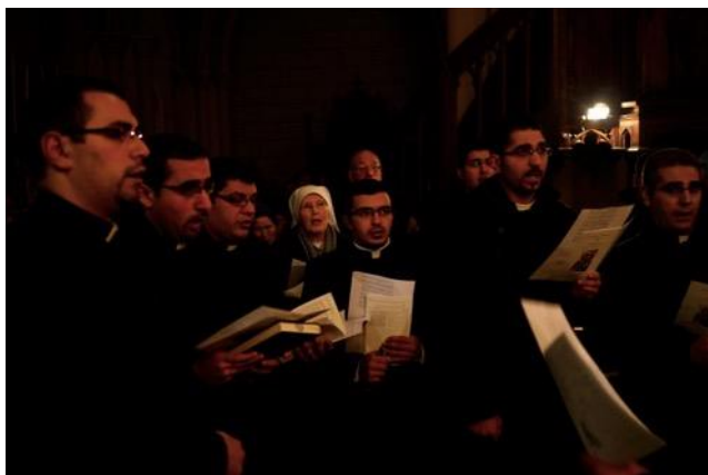
Le chœur du séminaire latin

« Parler de communion, comme nous y invite le Synode des évêques catholiques, c'est avoir le courage de contester les divisions. L'unité ne sera pas possible sans une profonde transformation personnelle ». Il dit également sa souffrance de ne pas pouvoir prier avec l'église grecque orthodoxe, qui refuse toute prière commune. « Notre responsabilité est grande. Deux milliards de chrétiens attendent cette unité. Jérusalem doit être pionnière dans la recherche d'unité, mais elle est la ville qui fait pleurer le Seigneur ».