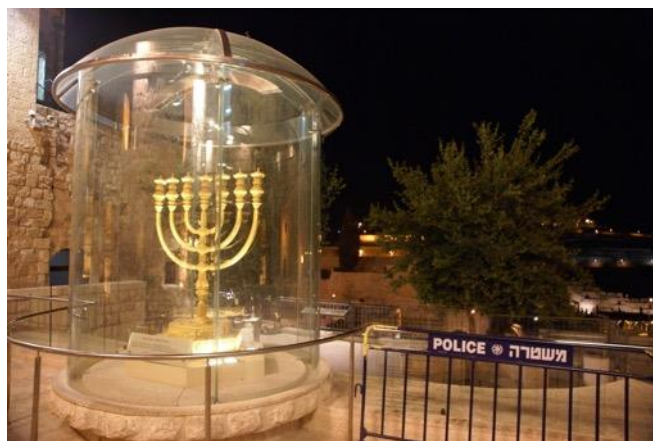
Reproduction du chandelier du Temple, rue ba-Tamid