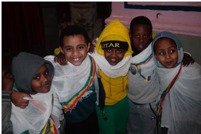
Les enfants éthiopiens ont leurs gestes d'unité