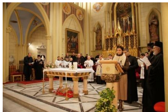
Lecture de la Bible en langue hébraïque.

F. Twal invite l'assemblée à prier spécialement pour une importante assemblée, le 6 février prochain, qui travaille à unifier les dates de Noël et de Pâques. Il faut, dit-il « accueillir tous les acquis du mouvement œcuménique, comme le Synode sur le Proche-Orient nous y invite. Ayons le courage de prier ensemble, lorsque, chefs religieux de Jérusalem, nous nous rencontrons ». J'ai été touché par la franchise et la simplicité de ce message, où s'exprimait aussi beaucoup de souffrance.