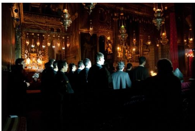
Le chœur des séminaristes arméniens