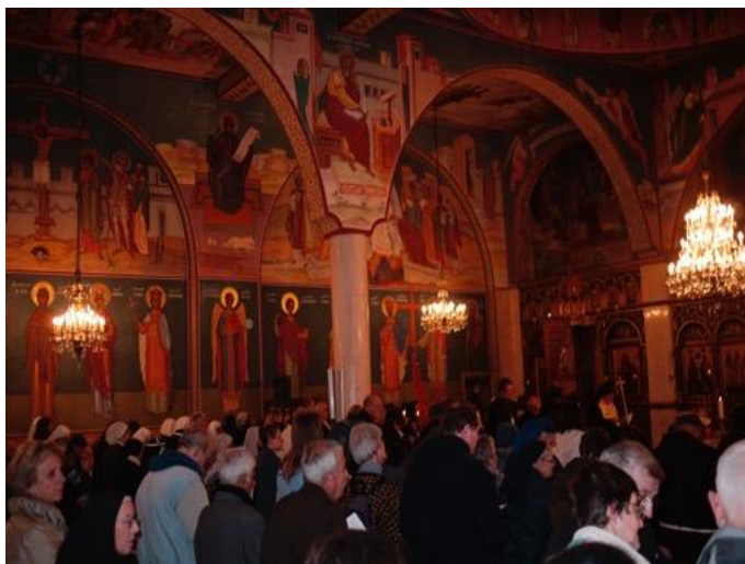
Dans l'église grecque-catholique de Jérusalem

J'entre dans l'église grecque-catholique, pas loin de la Porte de Jaffa. Pour cette ultime célébration, la foule est là. A l'entrée un poster avec l'embrassade d'André et Pierre, d'après une fresque de l'église, symbolisant